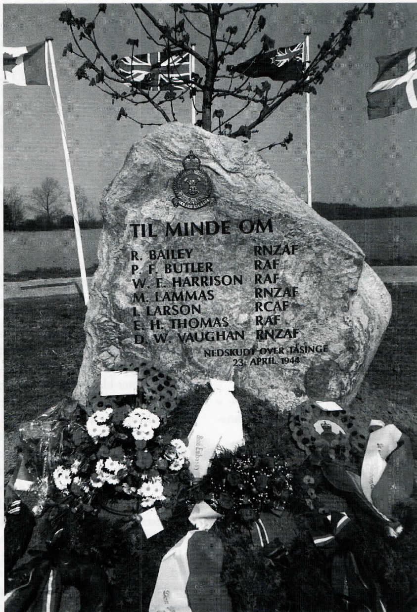
Mindestenen i Vemmenæs.

Vester Skerninge. Har som hobby arbejdet en del med slægtshistorie samt lokalhistorie vedrørende Vester Skerninge, Sydthy, Tåsinge og Langeland. Forfatter til bogen »Tåsinges Bomærker« (Tåsinge Museumsblad 1977), »Vemmenæs 23. april 1944« (Tåsinge Museumsblad 1994), samt artikler i tidligere udgaver af Tåsinge Årbog.