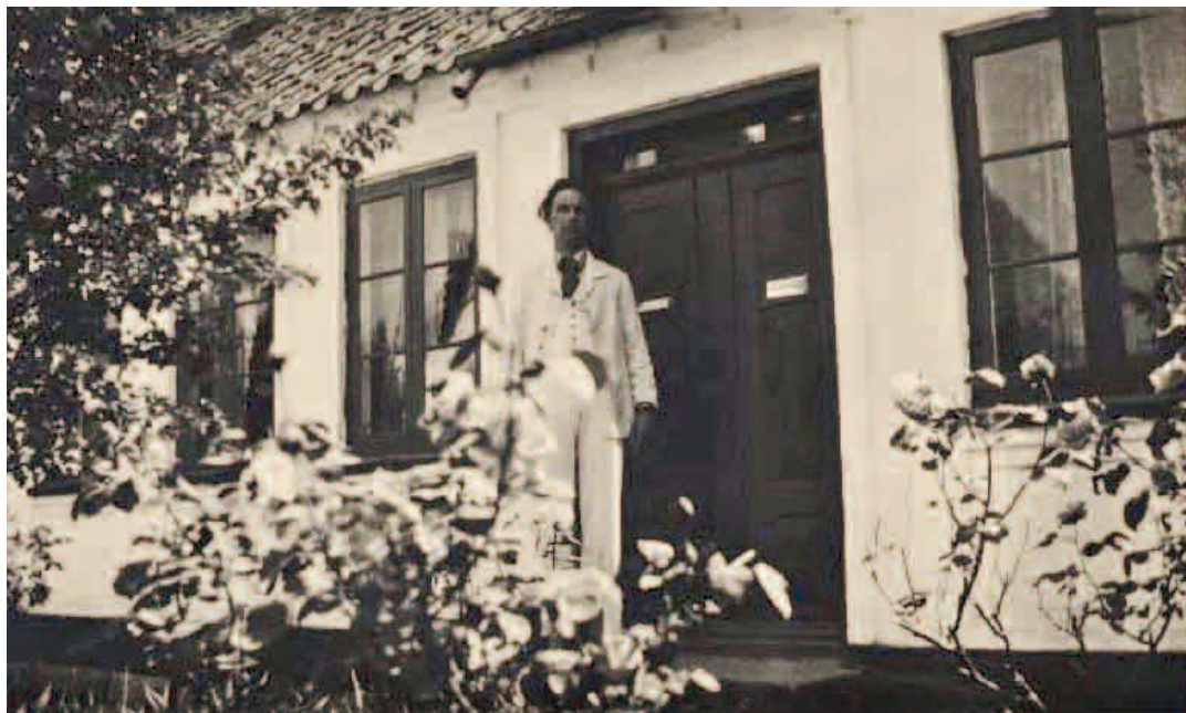
Rued Langgaard foran feriehuset i Grønnegade i 1928.