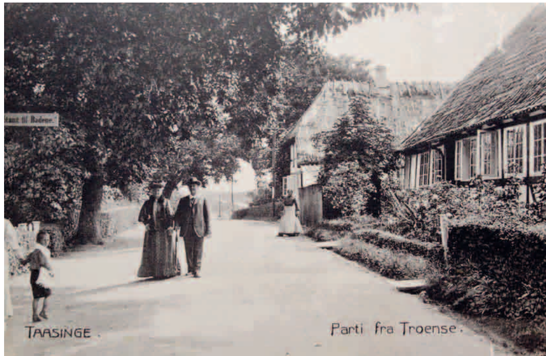
Promenerende på Troense Strandvej. (Postkort)

Hvem var disse feriegæster? Hvor boede de? Hvad foretog de sig, og hvorfor kom de til Troense? Det er bare nogle af de spørgsmål, man kan stille sig selv. En særlig udfordring møder imidlertid én, når man nærmer sig emnet, idet de officielle kilder viser sig at være sparsomme. I folketællinger og andre optegnelser nævnes den slags jo slet ikke, og hårde facts i form af for eksempel regnskaber eller oversigter over indtægter og udgifter fra sommerpensioner har det ikke været muligt at finde. Konkrete årsager til dette kan være vanskelige at påvise, men antagelig skyldes det blandt andet, at pensionatsdrift og værelsesudlejning i et og alt har været kvindernes verden og ikke figureret som officielle erhverv. Det har derimod fungeret som en kærkommen ekstra