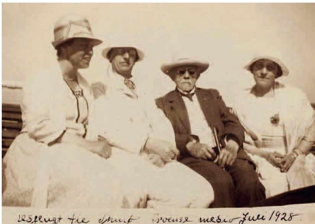
Rued Langgaard og hustruen på udflugt til Thuro i 1928. Parret ses til venstre. Det vides ikke, hvem det andet par er.