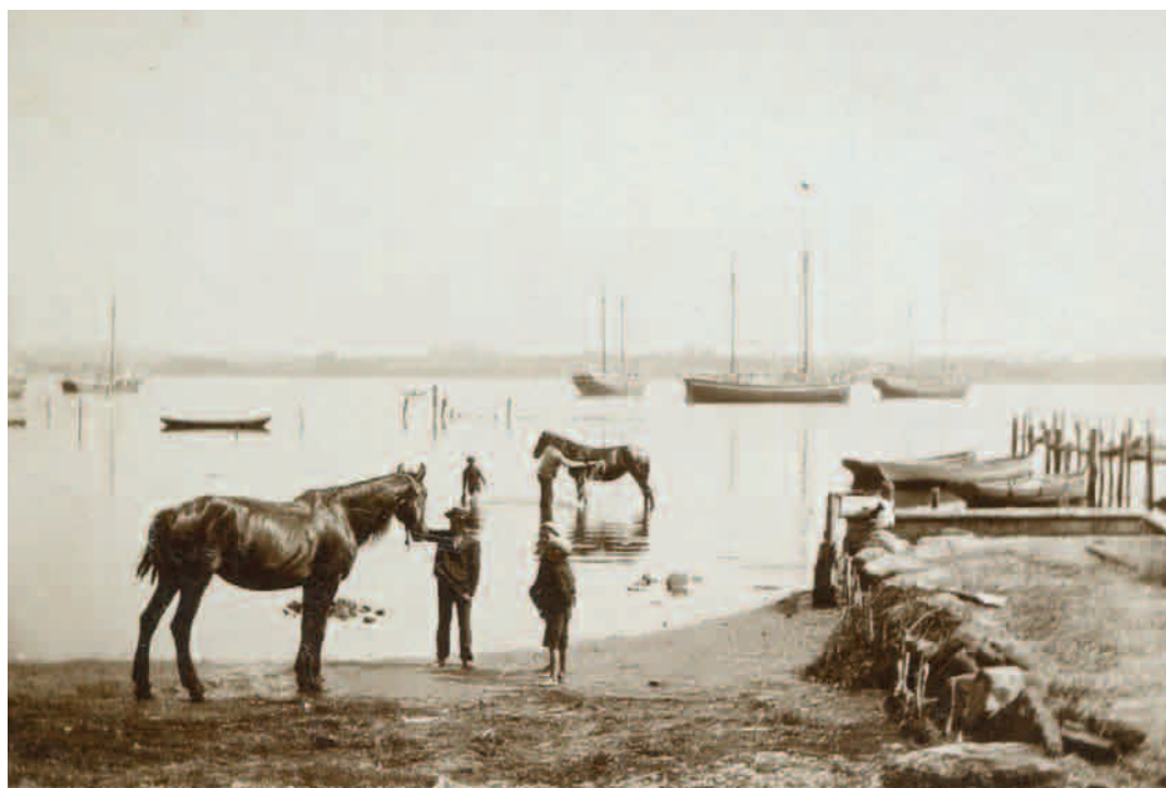
En stille sommerdag ved Badstuebroen i Troense. (Foto: 1905, H. Palludan Rasmussen)