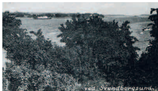
Badepension Thorseng. (Postkort)