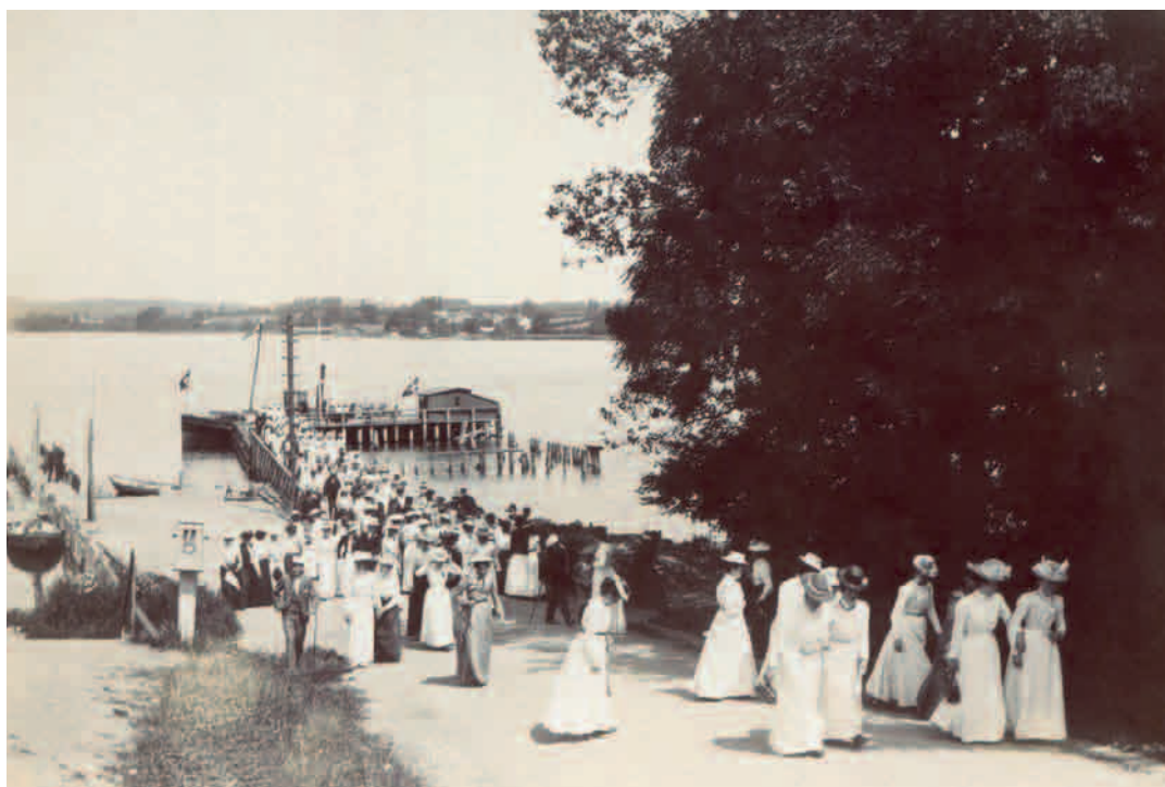
Elever fra Ryslinge Højskole besøger Troense. (Foto: 1905, H. Palludan Rasmussen)