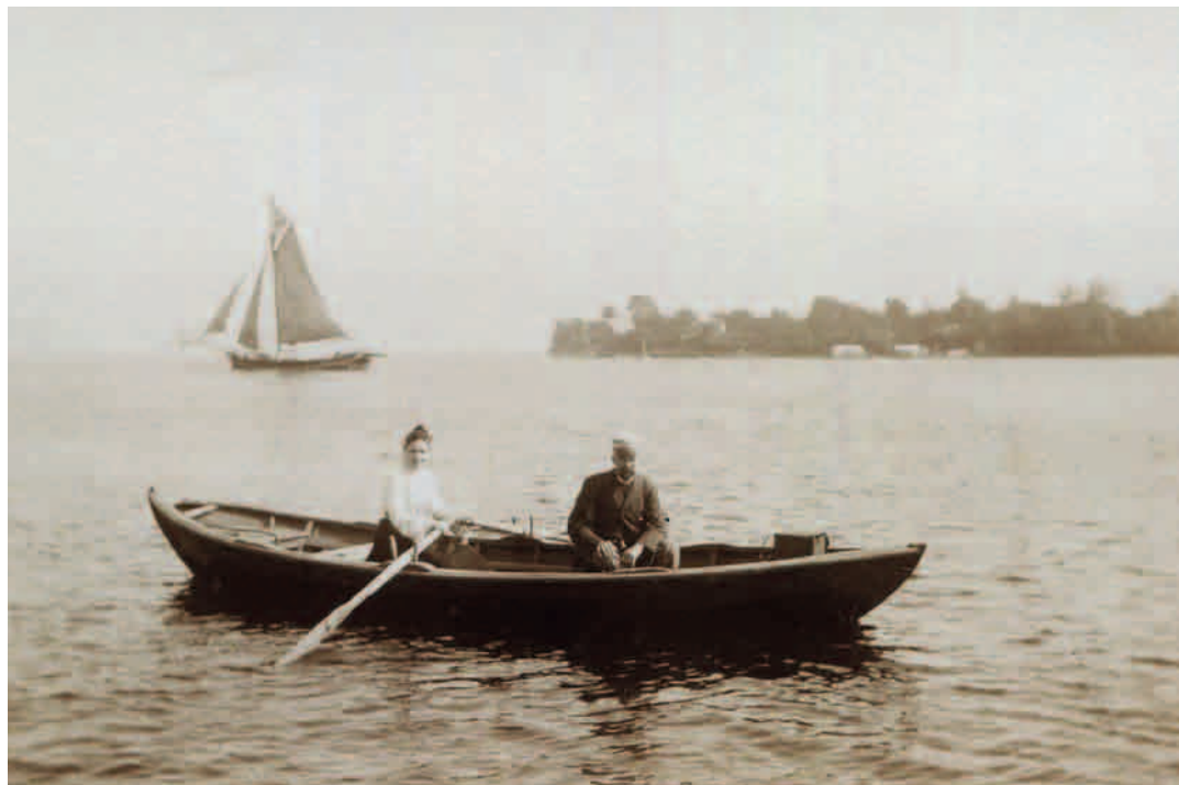
Feriegæster til »søs«. (Foto: 1905, H. Palludan Rasmussen)