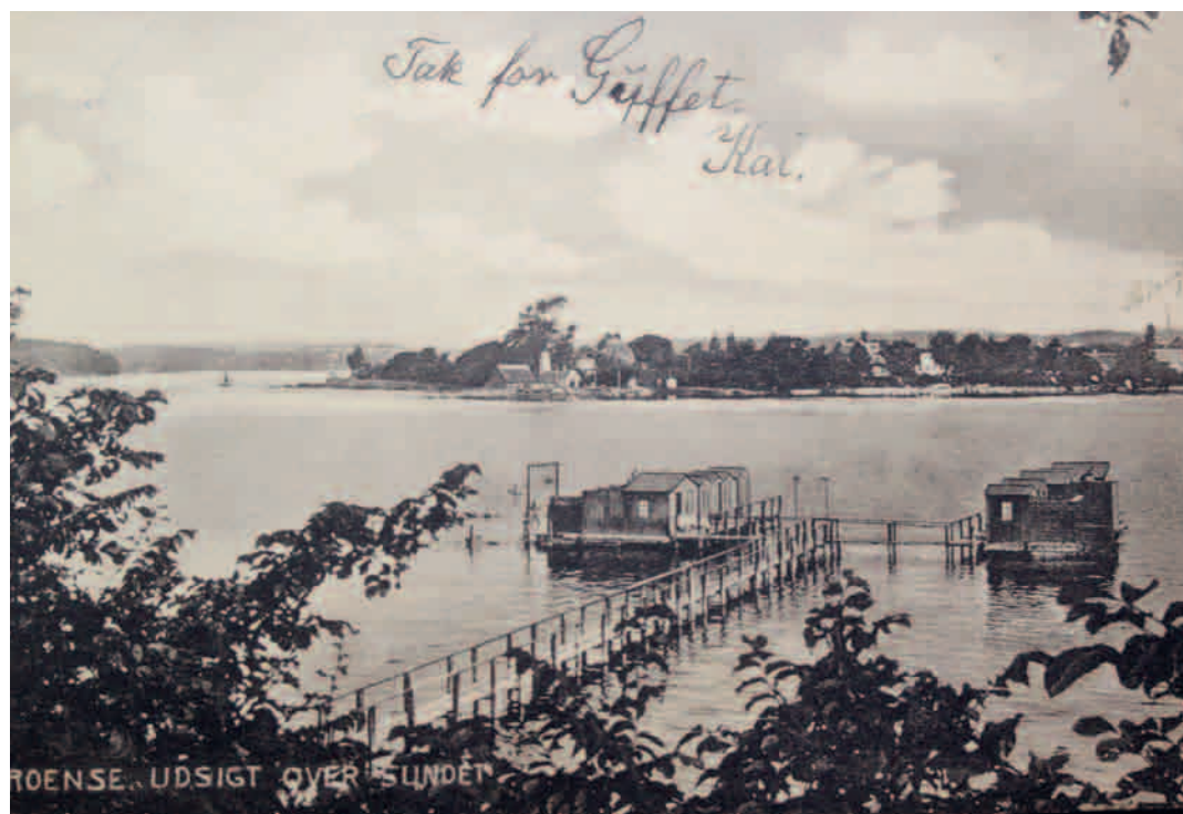
Badeanstalten. I venstre side ses et stativ, som børnene kunne hænge i og lære at svømme. (Postkort) Afsenderens søn har skrevet en hilsen med tak for »guffet« til familiens husassistent derhjemme.

Muligheden for adspredelser om aftenen var der også for dem, der ønskede at gå ud. I de første år under turismens fremmarch, kunne