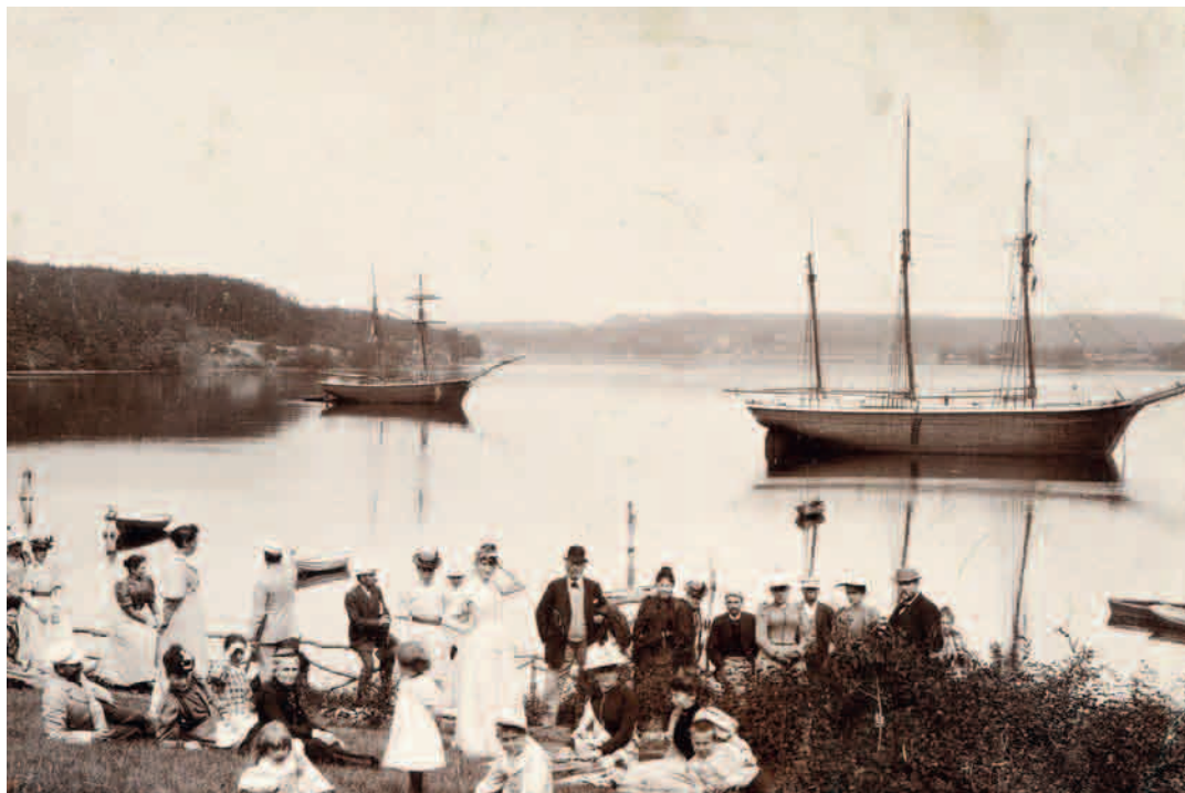
Smuk sommeraften i Troense. (Foto: 1905, H. Palludan Rasmussen)