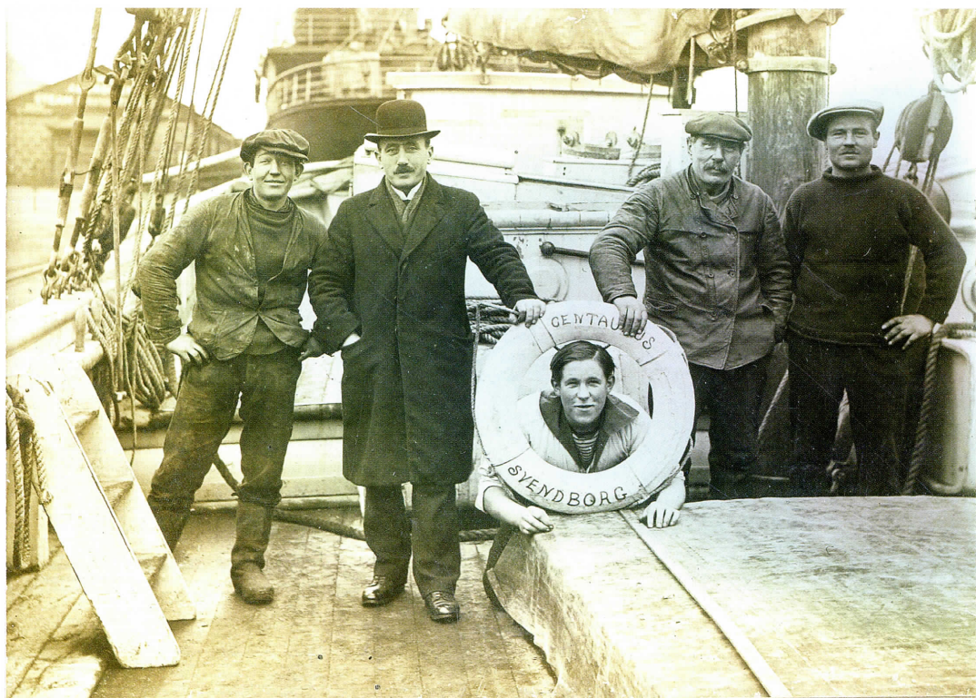
Skonnerten Centaurus i Svendborg Havn, muligvis er det skibets første besætning, som er med på billedet. Skibet blev søsat 1919.