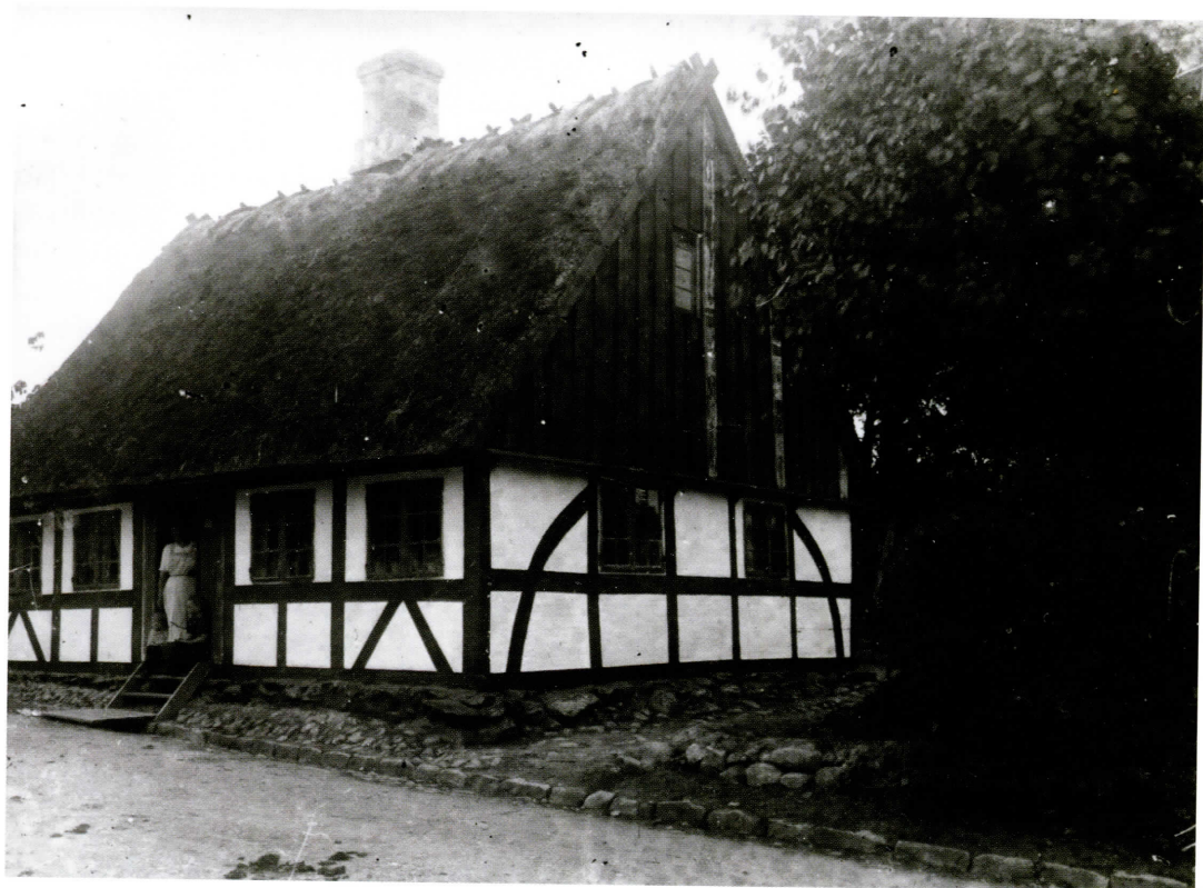
Kaptajn Rasmussens hus, Badstuen 4, ca. 1915.