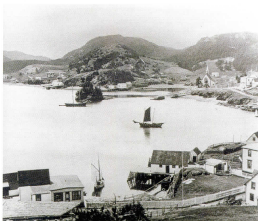
Den smukt beliggende Harbour Buffett.

Spencer Cove og Harbour Buffett eksisterer ikke som havne længere. Harbour Buffett blev anlagt udelukkende med fiskeeksport for øje og blev nedlagt i et af den canadiske regerings relokeringprojekter i 1967. Det var kun et lille samfund «Centaurus» satte kursen imod.