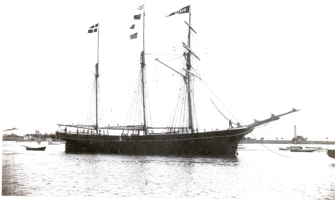
Skonnerten "Mercur".