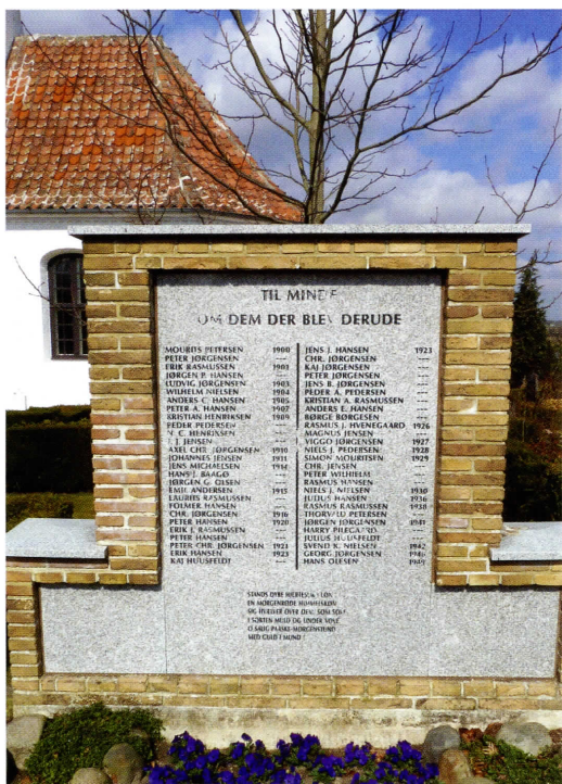
Mindesten på Thurø Kirkegård.

Svendborg Avis under Skibsefterretninger under SØ og SUND følgende: