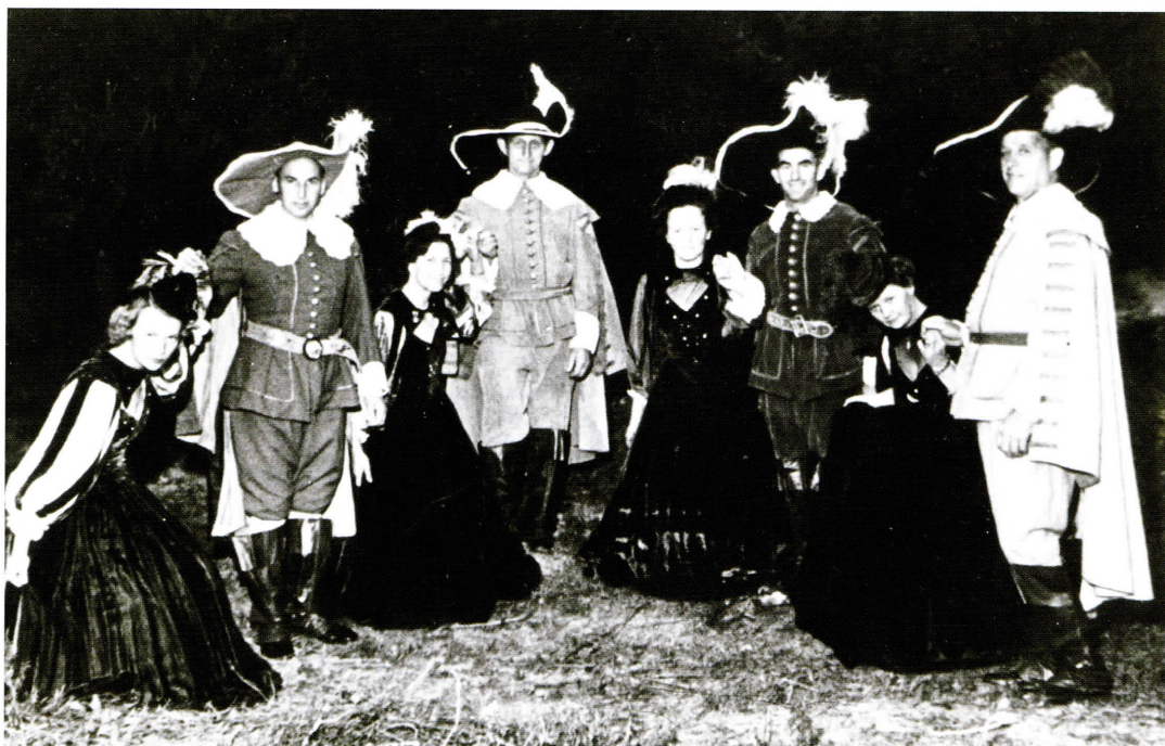
Danserne i kostumer fra Det Kongelige Teater.

Søfolkene fra Troense tager det helt roligt og en lun bådsmænd svarer: