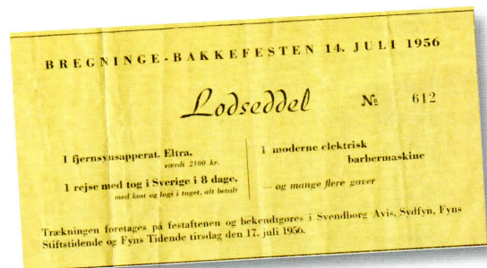
Hovedgevinster i lotteriet.