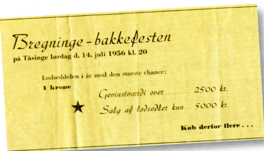
Forside på lodseddel.

Der lød eskimotrommeklang og stenalderfolk befolkede scenen. De talte et oldnordisk-angelsaksisk blandingssprog, som viste sig forståeligt for tøsinger.