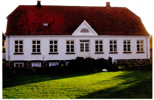
Skaregaards stuehus set fra havensiden.