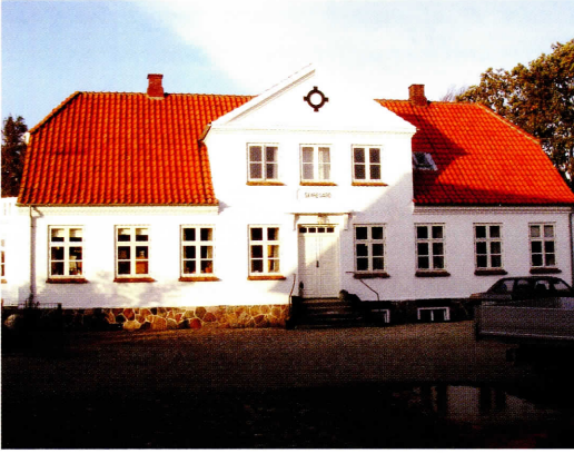
Skaregaards smukke stuehus, opført 1925.