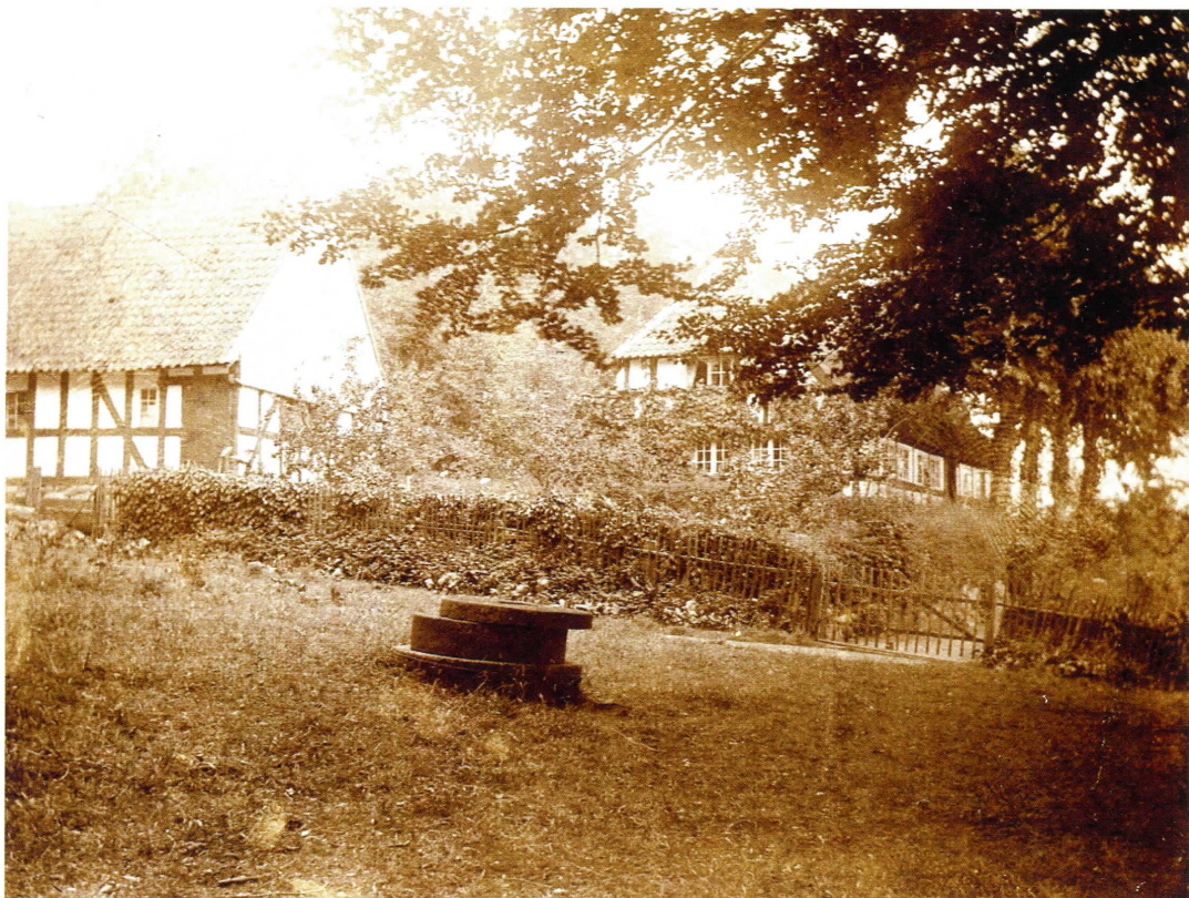
Skovfogedhus i Bregninge Skov ca. 1903.

Jeg rejste fra Svendborg, Lørdag, den 3. September til Nordborg, det var fint Vejr, saa jeg havde en fin Tur med Færgen over til Mommark på Als. Fra Mommark tog jeg saa med Rutebil til Nordborg. Jeg var ikke mere end 4 Timer om at tage fra Svendborg til Nordborg. I Nordborg besøgte jeg en Fætter, som har en