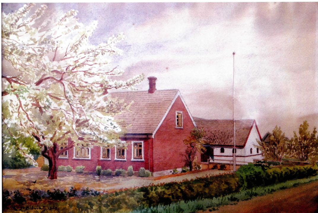
Den nye gård, nuværende adresse er Vårøvej 18. (Maleri af E. J. Bilving)

og engang talte vi 67 skud. Det var også et stort gilde. Jeg husker, at de voksne havde en stor sal og vi børn en mindre, så vi alle kunne danse, og det varede hele natten.