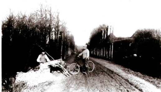
Stenslager arbejder ved vejen nær Vejlegaarden.

havde jeg svært ved på egen hånd at skabe denne kontakt.