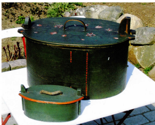
To slags tejner.