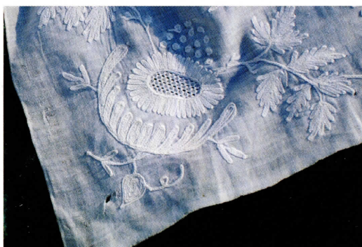
Tamburering på tørklædet.

del) i ensfarvet uldstof også kaldet en klokke, derunder et eller flere underskørter. Det var vigtigt, at man var smal om livet, men havde bredde hofter, derfor tog kvinderne flere underskørter på under klokken. Det kunne også have den fordel at holde varmen. Un-