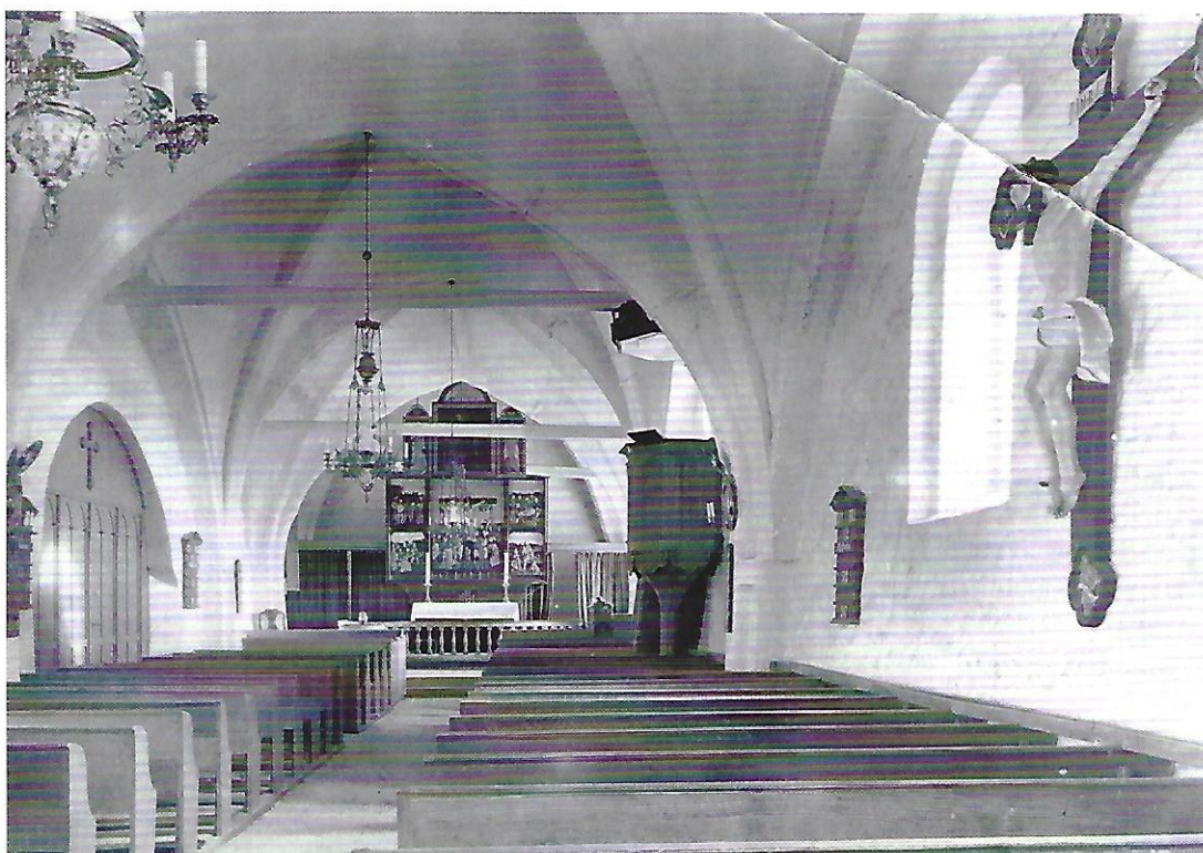
Bjerreby gl. kirke.

Det var en større Landsbykirke, bygget som de fleste Kirker med Alteret i Øst og Taarnet i Vest. Vaabenhuset med indgang i Syd var et stort hvælvet Rum under Taarnet. Der var Bænke omkring ved Væggene, hvor Folk kunde sidde, naar de kom for tidlig til Kirke, desuden var der Trappe op til Loftet, hvor Orgelet stod. Derfra kom man saa ind i