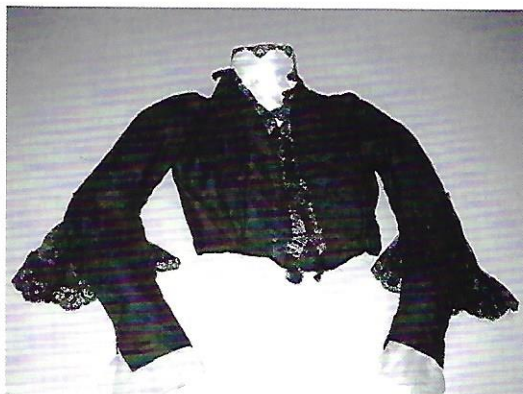
Blusen før og efter konservering.