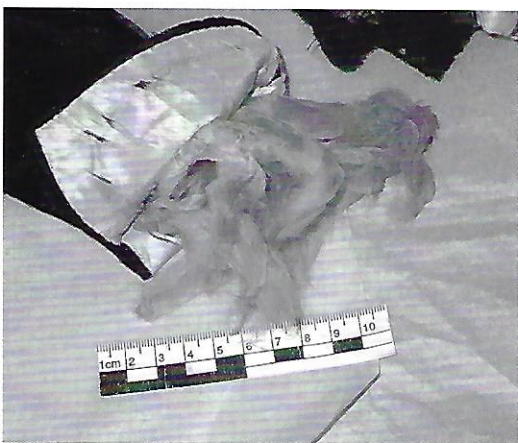
Her ses tydeligt hvor medtaget ærmerne var.

Når så mange penge var blevet anvendt på konservering af kjolen, ønskede Tåsinge Museum naturligvis også at kunne vise kjolen frem for et større publikum. Derfor fremstillede konservatorerne en speciel kasse, hvori kjolen kunne anbringes permanent. Det er således ikke længere nødvendigt for museets medarbejdere at håndtere kjolen, men desværre kan den kun tåle at blive udstillet i tidsbegrænsede perioder.