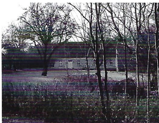
Den gamle godsforvalterbolig under Valdemars Slot. Pederskovgård.