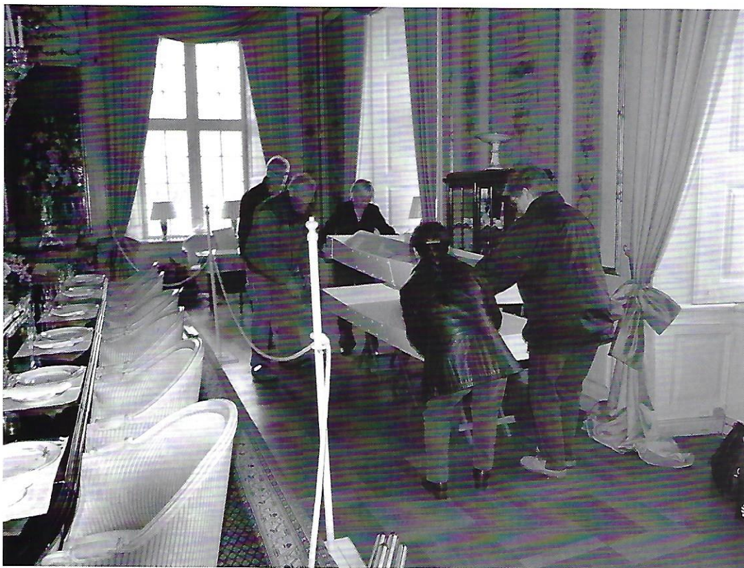
Der var mange hænder om at anbringe brudekjolen korrekt ved bryllupsmessen på Valdemars Slot i 2007.