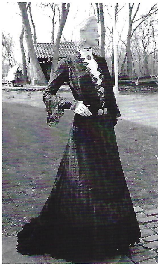
Brudekjolen fotograferet i haven på Tåsinge Museum, da den endnu var udstillet på gine.

Brudekjolen er syet i kippervævet silkestof i en dybrød farve. Hele kjolen er overtrukket med sort blondestof af tyl. Faconen er todelt, en højhalset bluse og et skørt med en bred blon-