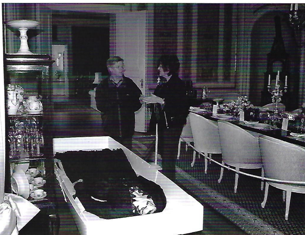
Endelig er brudekjolen på plads i sin nye kasse.