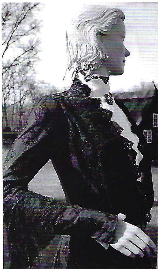
Nærbillede af brudekjolen.