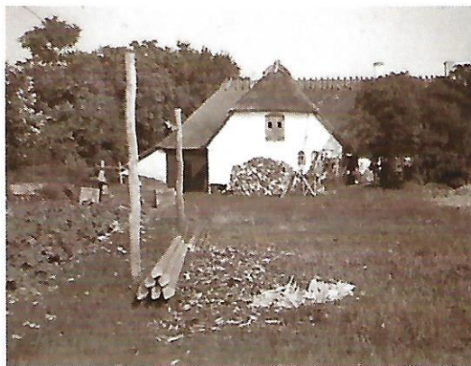
Huset og Vornæs Skov set fra stranden.

Der var i øvrigt jollefart til Skarø fra dette sted. Jeg husker, at der tit i porten var parkeret cykler, som tilhørte de mennesker, som var taget en tur til Skarø.