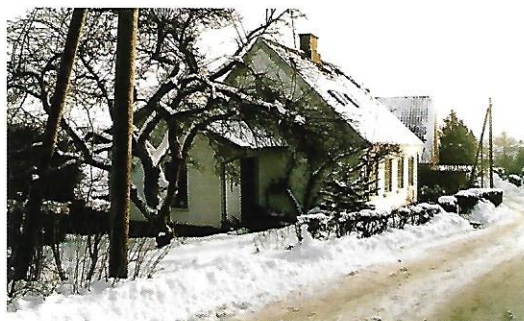
Skovvejen 16 – nu Pilekrogen 16, Troense.

For os børn føltes det, som om både vej, skov, eng og strand tilhørte os. Vi legede og bevæ-