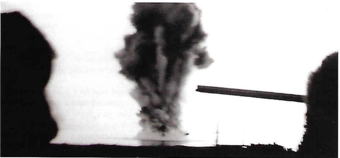
Amatørbillede af bombesprængningen ved Vornæs.

Krigen og angsten for besætterne – tyskerne - må trods alt alligevel have sat sine spor. Når jeg skulle køre ærinder for mormor til købmanden ved Vejlen, kørte jeg hellere ind gen-