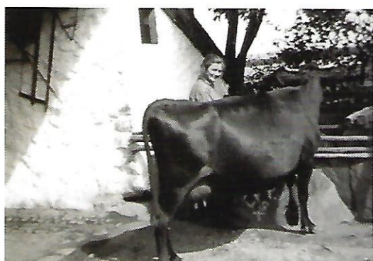
Thora Poulsen med en af sine køer.