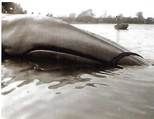
Den strandede hval.

Hjemme havde vi en repos ud mod vandet. Den har altid været og bliver stadig kaldt »Rabussen«.