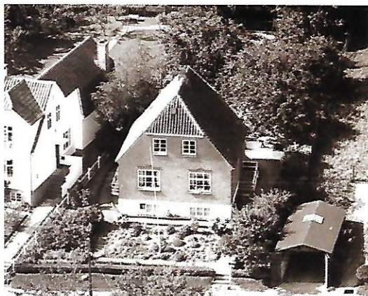
Skovvejen 7 – nu Pilekrogen 7, Troense.

Ærgerligt, at jeg lå i en vugge i de to år, vi