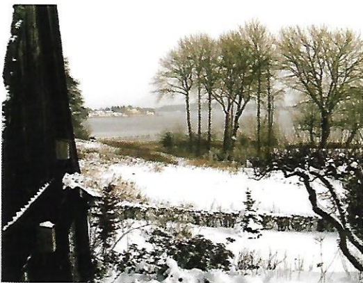
Udsigt over engen.

På havisen var der helte og flotte fyre. Det var dem med kunstskejter og isbåde. De var eftertragtede emner for teenagepigerne.