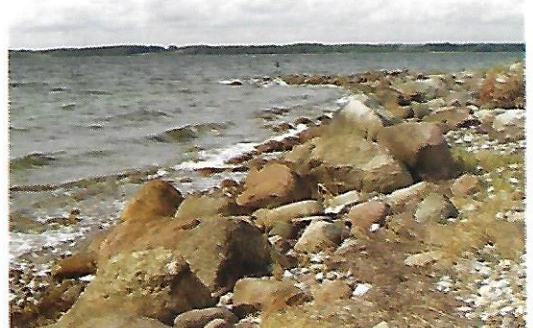
Stenene ved stranden i Vornæs.