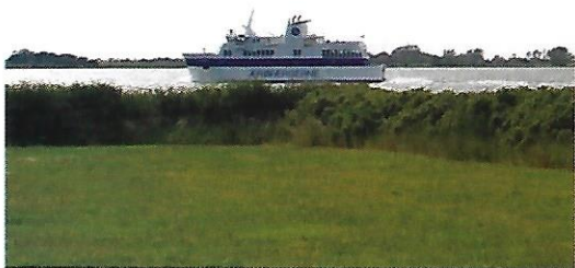
Ærøfærgen 2009 i farvandet mellem Vornæs og Skarø.

Når vi havde spist frokost, skulle mormor have fred en halv time, hvor hun satte sig ved