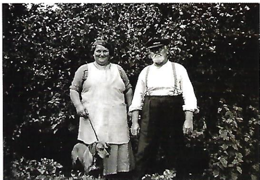
Farmor og farfar hjemme i Troense.

pet med Sfinksen og dugen af silke på det lille ovale bord i stuen.