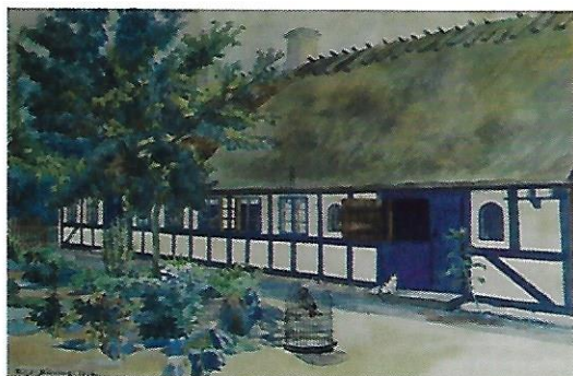
E.J. Bilvings maleri af huset 1933.

Om morgenen skulle vi blive i vores senge, indtil stueuret havde slået otte slag. Det var dog ikke så slemt, for vi vidste, at vi kom op til et morgenbord med mormors friskbagte hvedebrød og hjemmelavet marmelade, pudersukker eller honning fra vores fars bista-der.