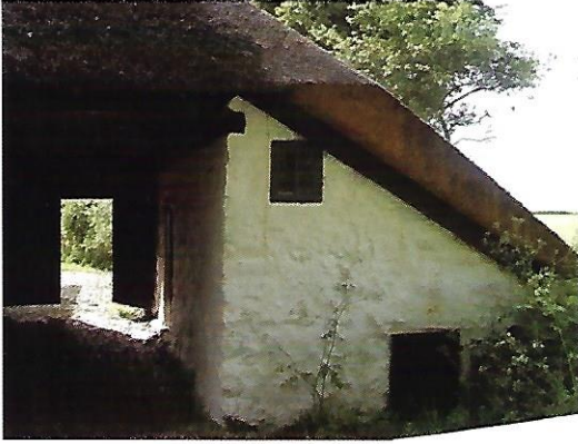
Grisehuset anno 2009, hvor der i min barndom også var WC.

Her kunne man så sidde og kigge på, at grisene guffede i sig eller roede i halmen. Om aftenen kunne det godt nok være lidt uhyggeligt, men den medbragte lommelygte gav lidt tryk!