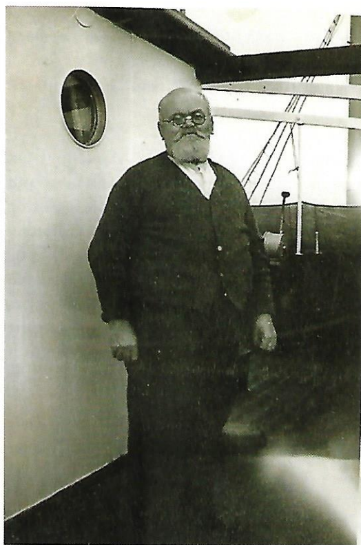
Hovmesteren om bord på et af Rederiet Torms skibe.

Når og hvis jeg blev uvenner med mor og far, kunne jeg hurtigt nede hos farmor finde trøst eller få gode råd til løsning af problemet.