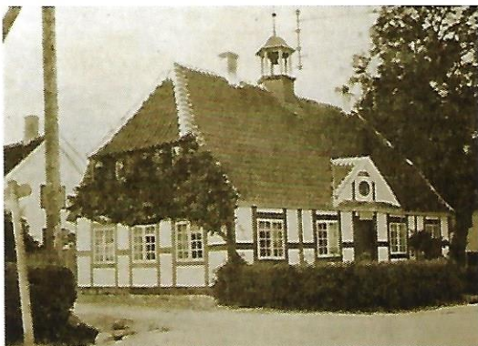
Gammelt billede af Troense Skole.