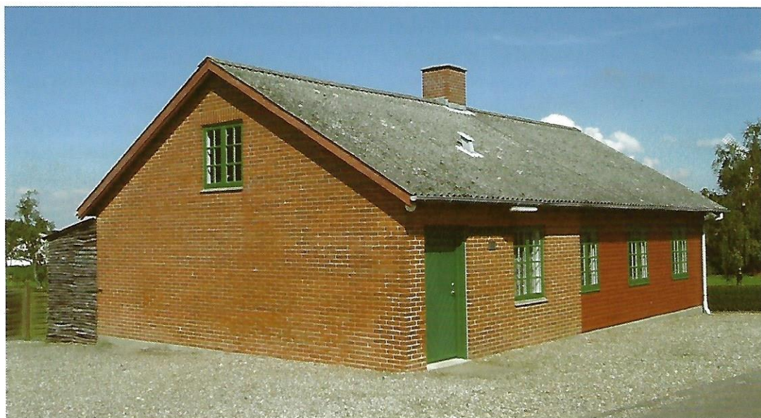
Husflidsskolen i Bregninge 2008.