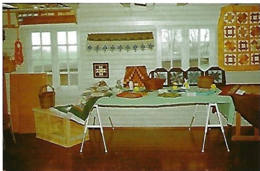
Fra en udstilling med træarbejder, pileflet og håndarbejder i husflidsskolen.

Udstilling i husflidsskolen i Bregninge d. 23. marts 1997: Det er første gang, den finder sted her, og det blev imødeset med stor spænding. Dørene åbnedes kl. 14. og det blev en virkelig god oplevelse. Der var lavet en flot udstilling med hjælp fra lederne, mange fine ting af træsløjd, pileflet, knipling og patchwork. Der kom over hundrede mennesker til udstillingen.