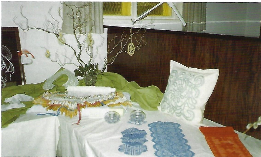
Udstilling af håndarbejder på Hotel Troense.