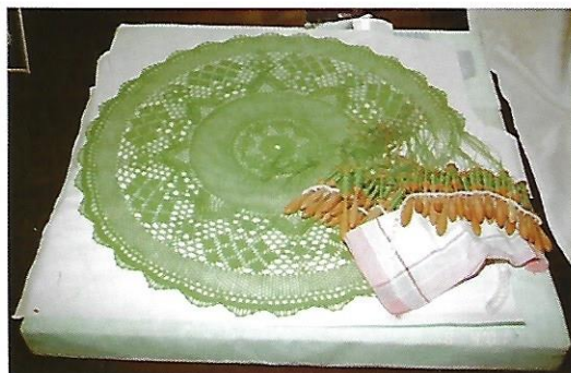
Udstilling af kniplingsarbejde