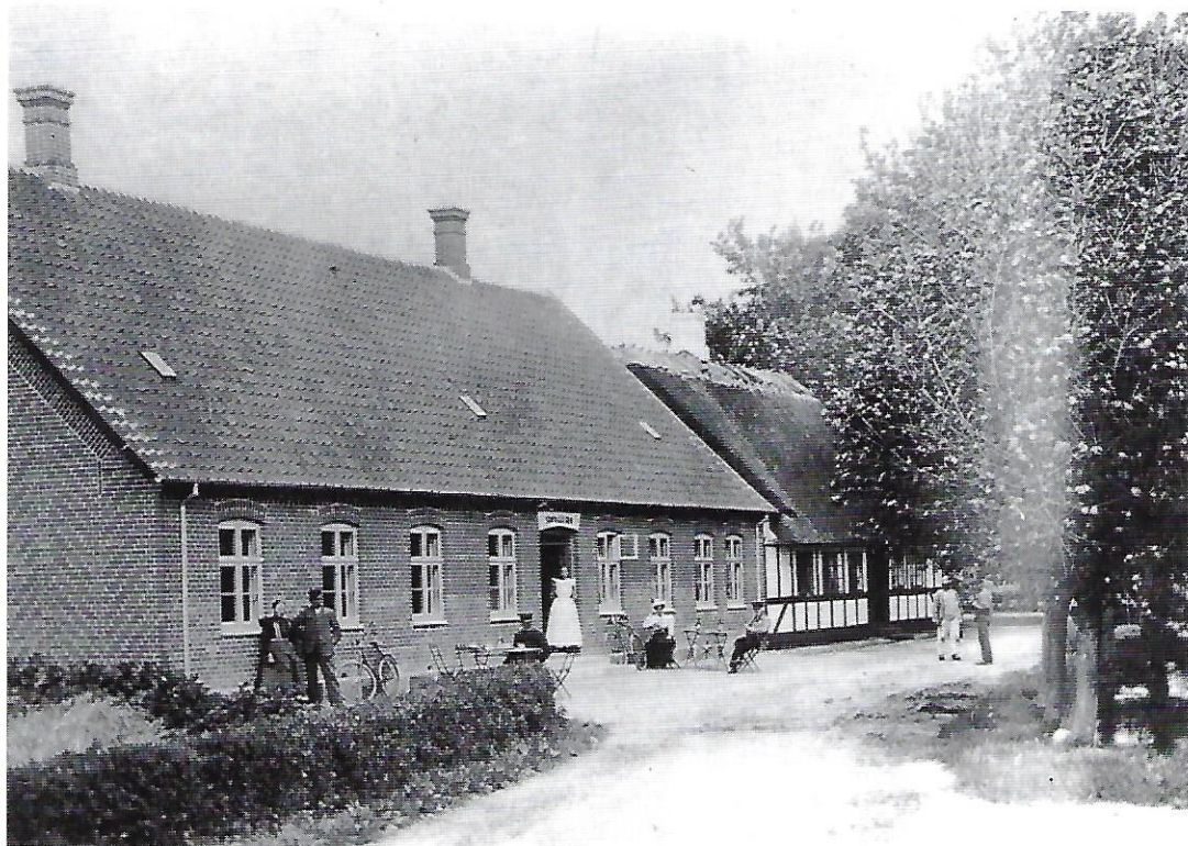
Skovballe kro var rammen om en husflidsudstilling søndag d. 8. maj 1904.

maj. 8. maj har konsulent Paff lovet at tale. 10. maj skal der være præmieuddeling og om aftenen dans.