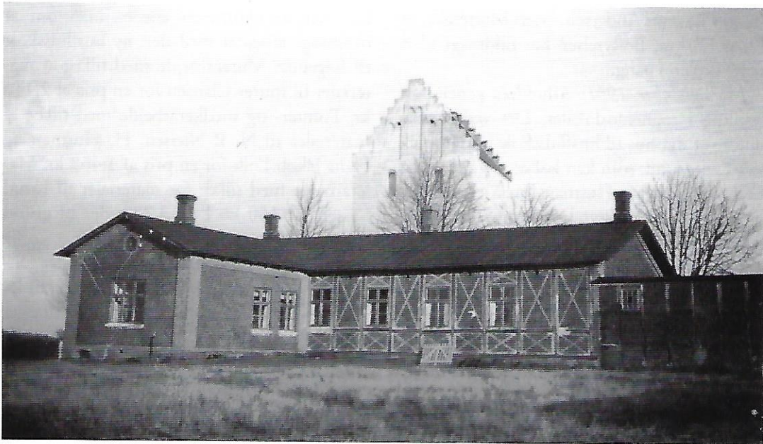
I det gamle forsamlingshus i Landet blev der holdt husflidsudstillinger frem til 1934 og siden i det nye hus.

Referatet fra generalforsamlingen d. 4. november 1947 indeholder følgende bemærkning: »Paa given Foranledning vedtoges det ikke at leje Husflidsskolen ud til Beboelse«.