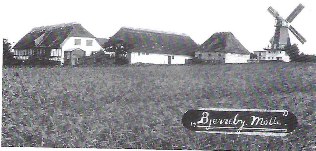
Bjerreby Mølle før branden i 1913.