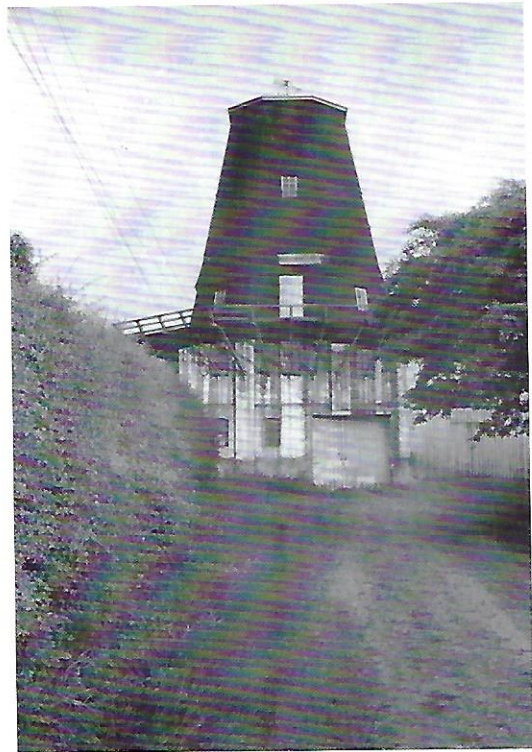
Bjerreby Mølle 24/06-1963.

I møllen blev installeret en forbrændingsmotor, og den blev årsag til, at møllen brændte i 1913-30/09, da en flamme fra motoren antændte noget petroleum. Møllen blev hurtigt genopført og fik derved det udseende, som den beholdt, så længe den blev brugt som kornmølle. Den havde muret underdel med gennemkørselsport, og den var forsynet med omgang. Overdelen var 6-kantet (8-kantet?) med tagpapbeklædning, og møllen forsynet med selvkrojer (automatisk drejning af hat og vinger ved hjælp af vindrosen) og selvsvikker (regulering af klapperne på