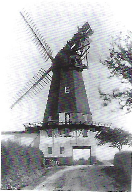
Bjerreby Mølle ca. 1920-1930.