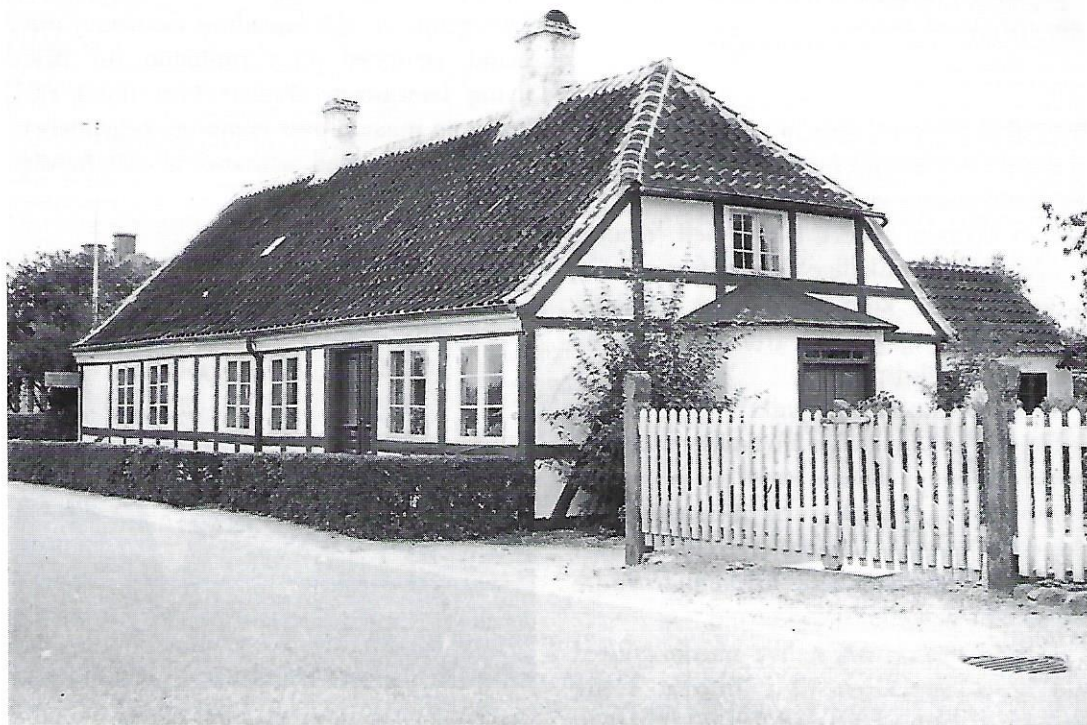
Huset Slotsalléen 12 i Troense.

Bosat i Gladaxe kommune fra 1956 til 2004. Nuværende adresse: Ny Vestergårdsvej 8, 3500 Værløse.