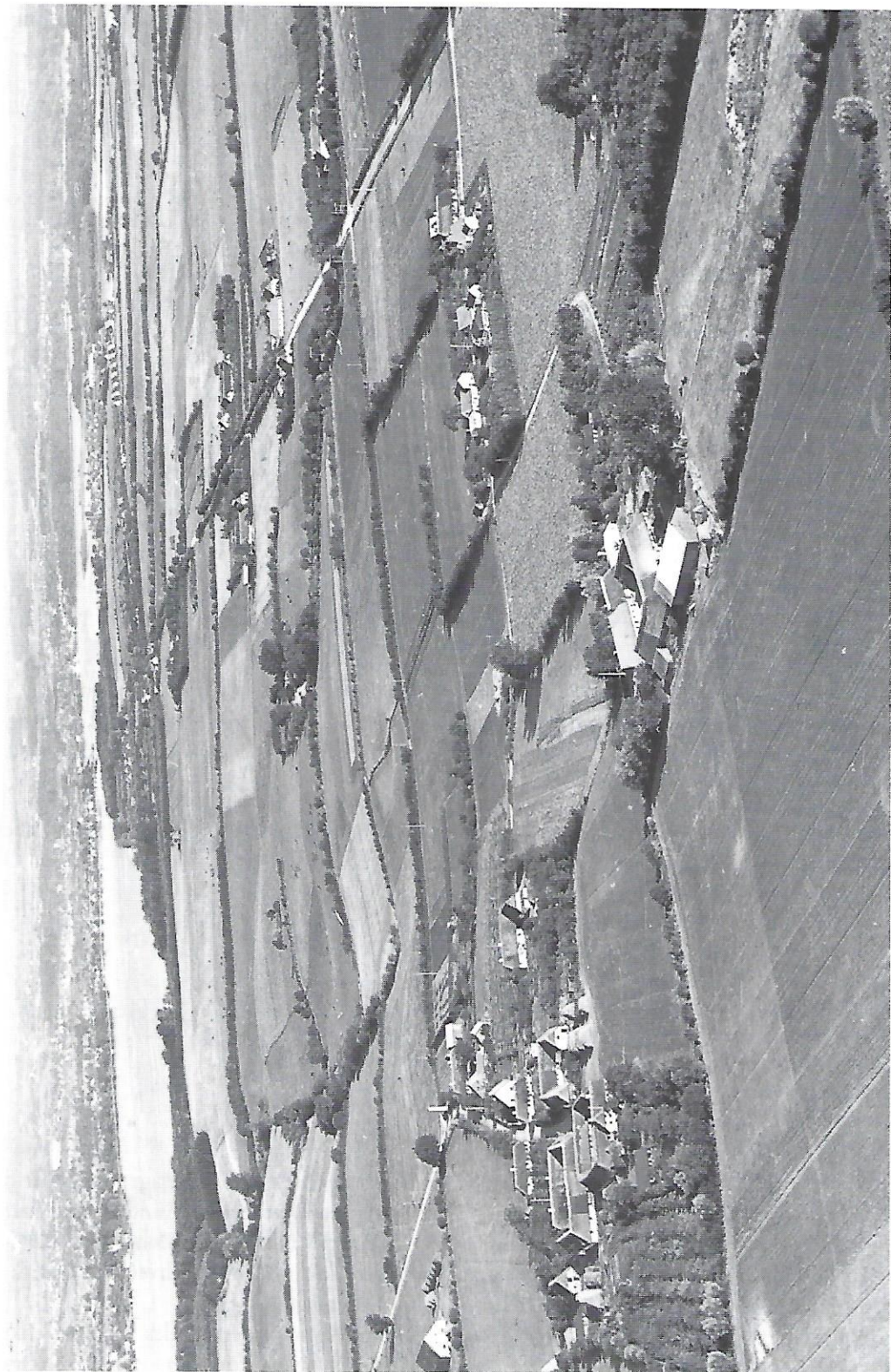
Luffoto af Bjernemark by set fra syd med dalen og markerne i baggrunden.