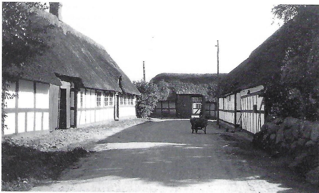
Vejidyl ved de 3 gårde i Bjernemark, "Drostgaarden" i midten.