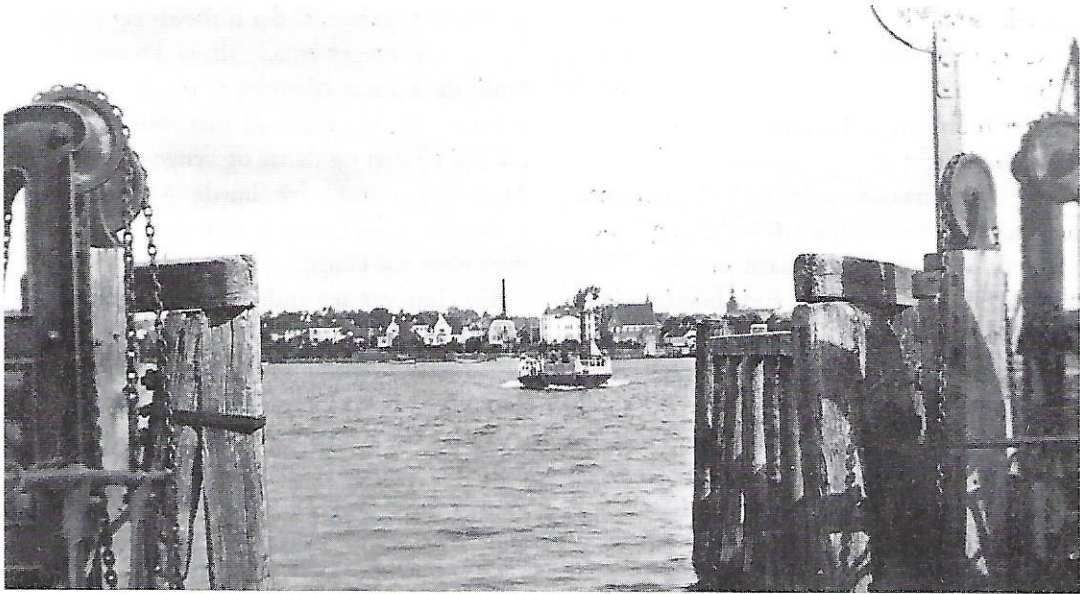
Dampfærgeren »Fritz Juel« på Svendborgsund.

han som Formand for Sygekassen skulde til Møde i Landet Forsamlingshus, til Kirke eller til Begravelse, for slet ikke at tale om, naar han en enkelt Gang foretog den lange Tur til Svendborg.