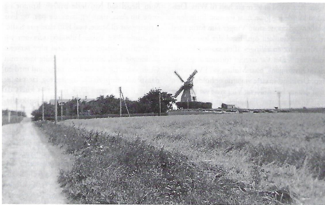
Staus Mølle, set fra Skovballe.