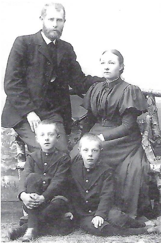
Familien Møller, Søby skole. (Foto før år 1900).

Men om Land fra Mand til Mand det gaar med Hovedrysten: Kornet fik vi vel i Hus, men vanskelig var Høsten.