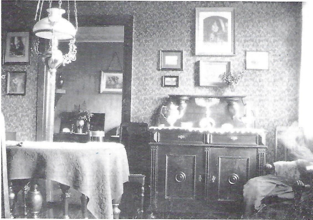
Interiør fra stuerne i Søby skole.

havde det der, og kunde ikke forstaa, at andre skulde leve saa kummerligt et Liv.