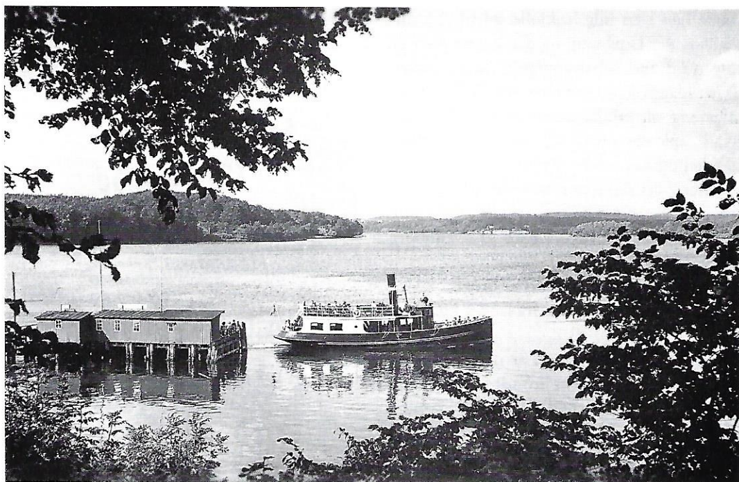
På skoleudflugt med »Helge«.