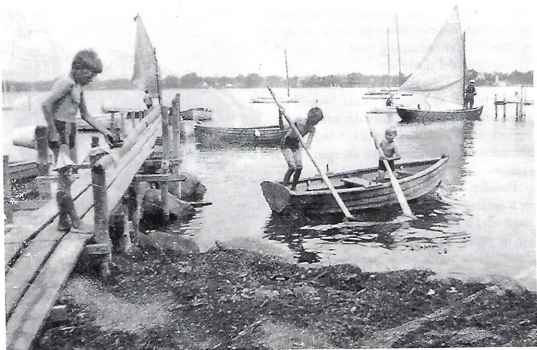
Som børn opholdt vi os meget ved stranden, her bådebroen ved Badstuen.