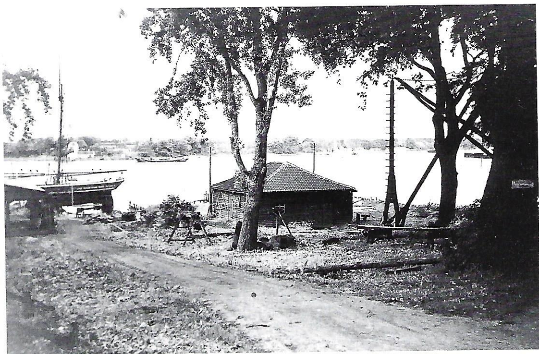
Jacobsens Plads. (Svendborg & Omegns Museum).