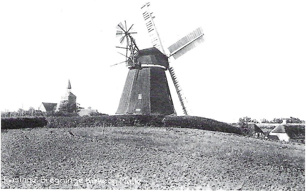
Møllen set fra nord og med Bregninge Kirke i baggrunden.