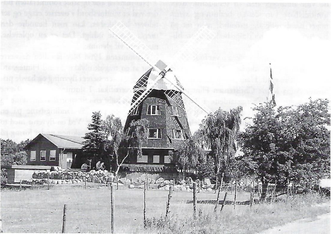
Foto fra juli 1993, da møllen havde fået nye vinger.