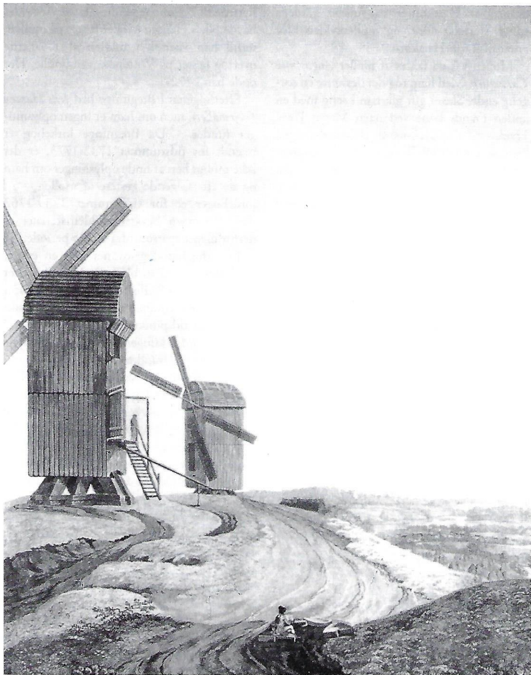
Stubmøllerne, der var i stand til at dreje om deres egen akse, var et almindeligt syn i det 18. århundrede. Her ses de på Bregninge Bakke. Vægmaleri på Valdemars Slot.