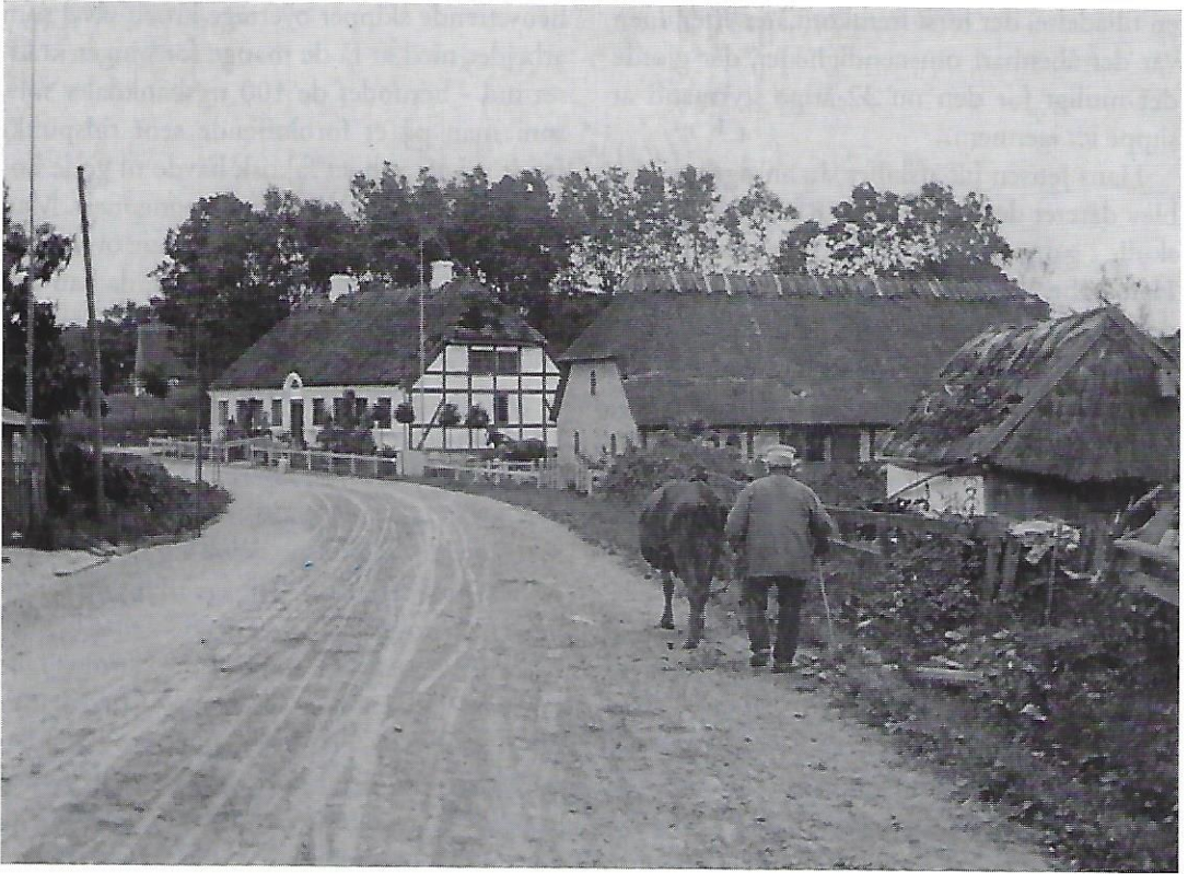
Fra den gamle vej sydpå gennem Bregninge by. Huset, nuv. Sundbrovej 58, hvori der omkring 1800 var kro, ses i baggrunden.