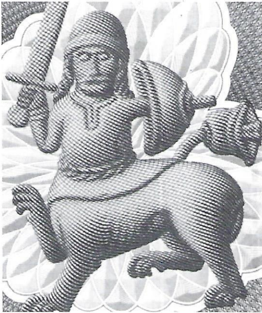
Kentauren, som den er gengivet på den nye 50-kroneseddel.

ser, blev tidligt kirkens eneste indgang. Oprindeligt var den yderdør mod syd, men fra ca. 1634 sad den inde i det våbenhus, som da blev tilbygget. I slutningen af det 19. århundrede blev den flyttet til sit nuværende sted, omtalt i det følgende.