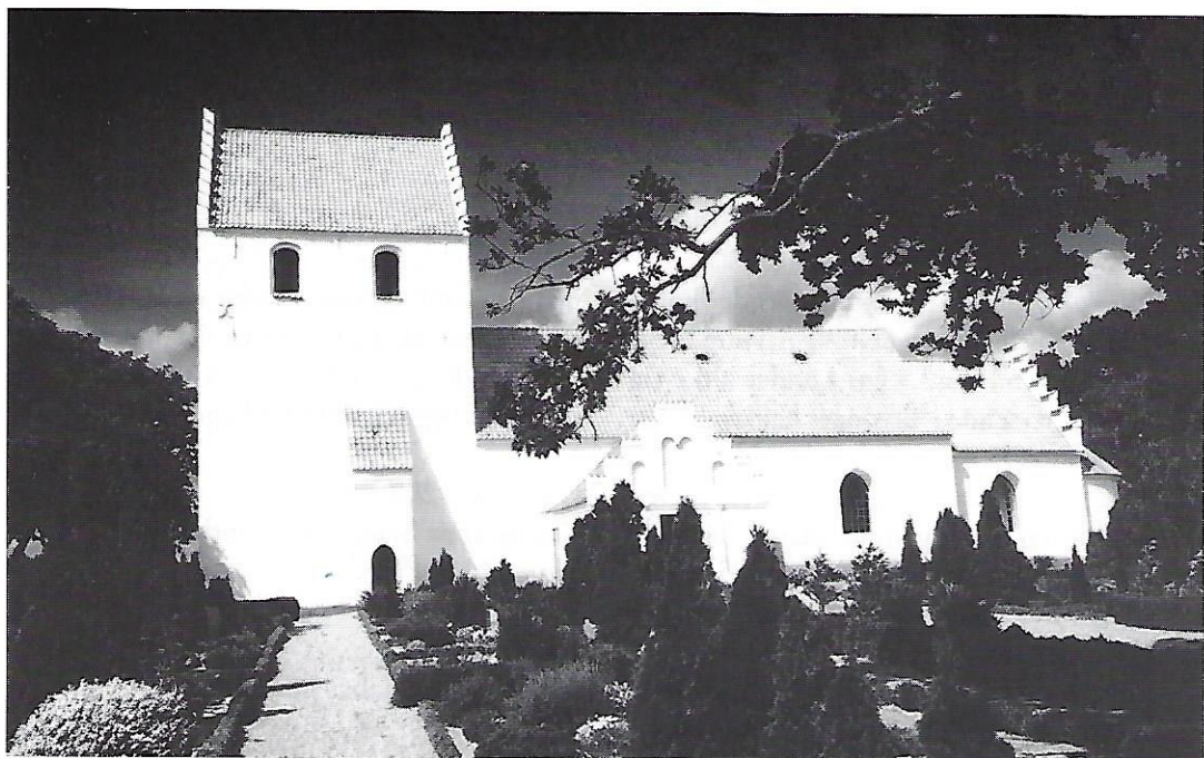
Landet kirke, efter restaureringen 1995. (Foto: Leif Svane, Svendborg).