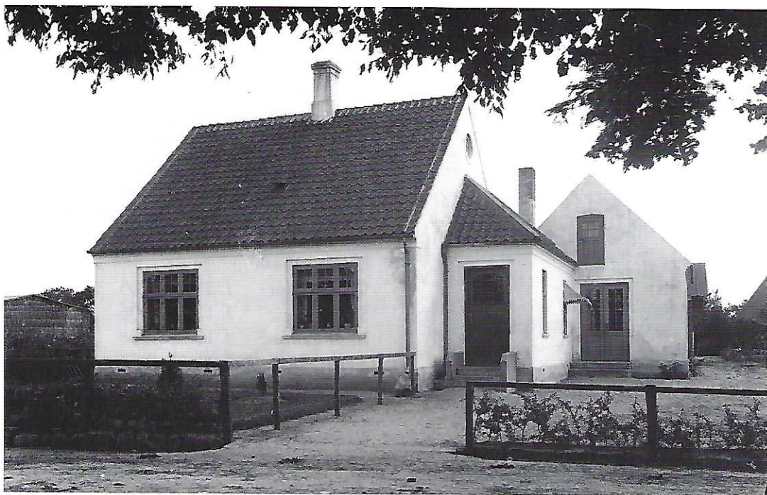
Familien Reckes mangeårige hjem (nuv. Bjerrebyvej 82).