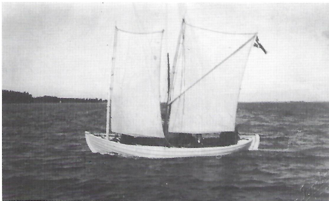
»Inga« fotografert af Herman Jacobsen ved havnemolen i Marstal, 1920.

med en såkaldt lidse-line, der er hægtet om masten med karabinhager; med den metode kunne smakkerne let rigges af og på, og det var en fast regel altid at tage sejlene med hjem til tørring efter endt tur; med den omsorg har de seneste to sæt bomuldssejl til »Inga» kunnet holde i 33 år mellem hver udskiftning. Systemet med den hægtede lidseline er muligvis indført fra Ærø, i al fald har man set mange andre smakkejoller i øhavet uden denne finesse.