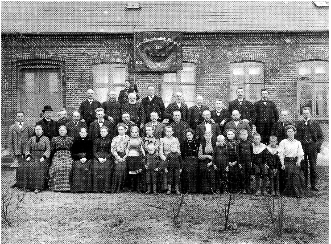
Medlemmer af »Taasinge Socialdemokratisk Forening«. Fotograferet d. 26. april 1908 foran Lundby Skole, i anledning af lærer L. A. V. Andersens bortrejse fra skolen.