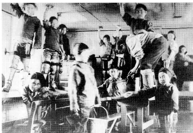
Frederiksen fulgte med i den nordeuropæiske pædagogiske debat. I de første år af dette århundrede blev gymnastiske systemer stærkt opvurderet i skoleundervisningen. Også i Holsteinsborg indførtes gymnastik - dog, som på dette billede, kombineret med rengøring af skolestuen.

Knapheden ses også af, at kolonien kun rådede over syv hundeslæder med en total bestand på 38 hunde i 1918. Kolonibefolkningens overlevelse lå helt i hænderne på det