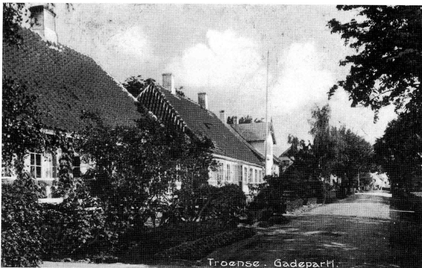
Parti fra Troense Strandvej nr. 72 til 76, som lokaliteten tog sig ud i 1890'erne, altså på det tidspunkt, hvor V. C. Frederiksen som ung mand boede i nr. 74 sammen med sine søskende og moderen.

af danske kolonier på den grønlandske vestkyst. 10