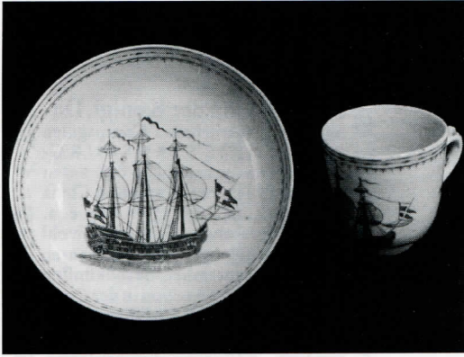
Kaffekop med tilhørende tallerken fra ca. 1750. Skibet fører dansk flag. Disse kopper er et typisk eksempel på bestillingsporcelænen, der af den kinesiske købmand er udført efter dansk ønske.

(Handels- og Søfartsmuseet på Kronborg).