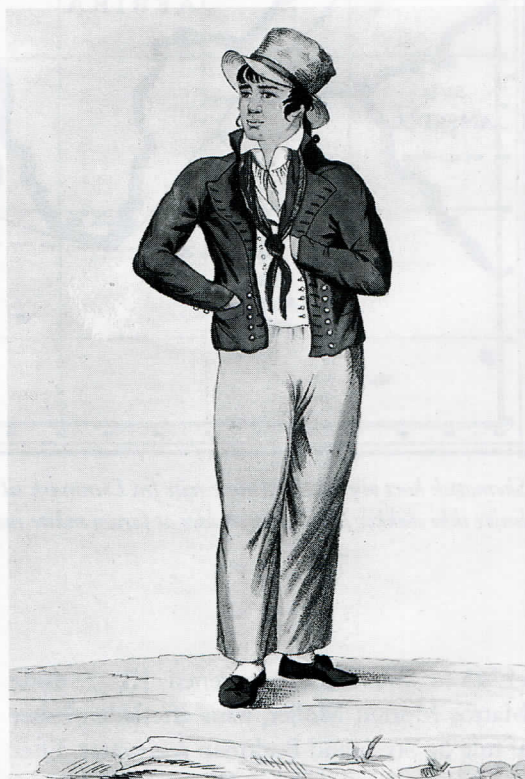
J. Rieters farvelagte stik fra . 1805: »En dansk matros kommende fra en Kinarejse«. Den selvsikre mand, der øjensynlig har penge på lommen, er klædt i en mørkeblå jakke, gule nankingsbukser, hvide strømper og sorte sko. Hertil en gul stråhat og et kinesisk silketørklæde, bundet i lavtsiddende knude.

Skibet lå ca. fem måneder på reden; det er en lang tid for en sømand at ligge stille med skibet. Der var naturligvis nok af arbejde om bord med at reparere sejl og tovværk, men mændene ville jo også gerne i land og se og opleve noget nyt. Morten havde hørt hjemme-