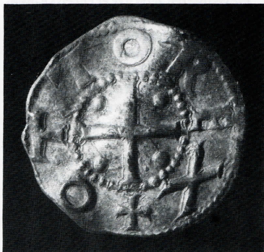
(Fig. 4). Mønterne på Svendborg og Omegns Museum – Ethelred den Rådvilde og Otto I.

ten, kunne derimod efter udtagning til hovedsamlingen betragtes som dubletter og blev desværre derfor i nogle tilfælde byttet væk – eller endnu værre – smeltet om. Der var reelt tale om en administration, som man finder den hos private møntsamlere, hvor dubletter byttes bort.