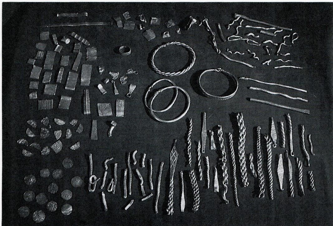
(Fig. 2). Iholmskatten, som den kunne ses på Svendborg og Omegns Museum 1986-1991.

Fire intakte sølvarmbånd, hvoraf det ene er dannet af tre sammensnoede sølvtråde, samt 135 stykker brudsølv, fortrinsvis itubrækkede armringe, samt sølvbar-