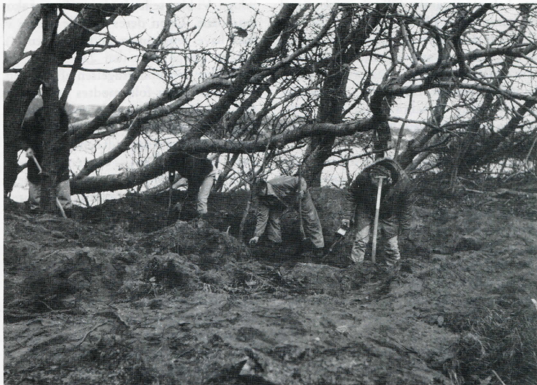
(Fig. 3). Det genfundne hul undersøges.