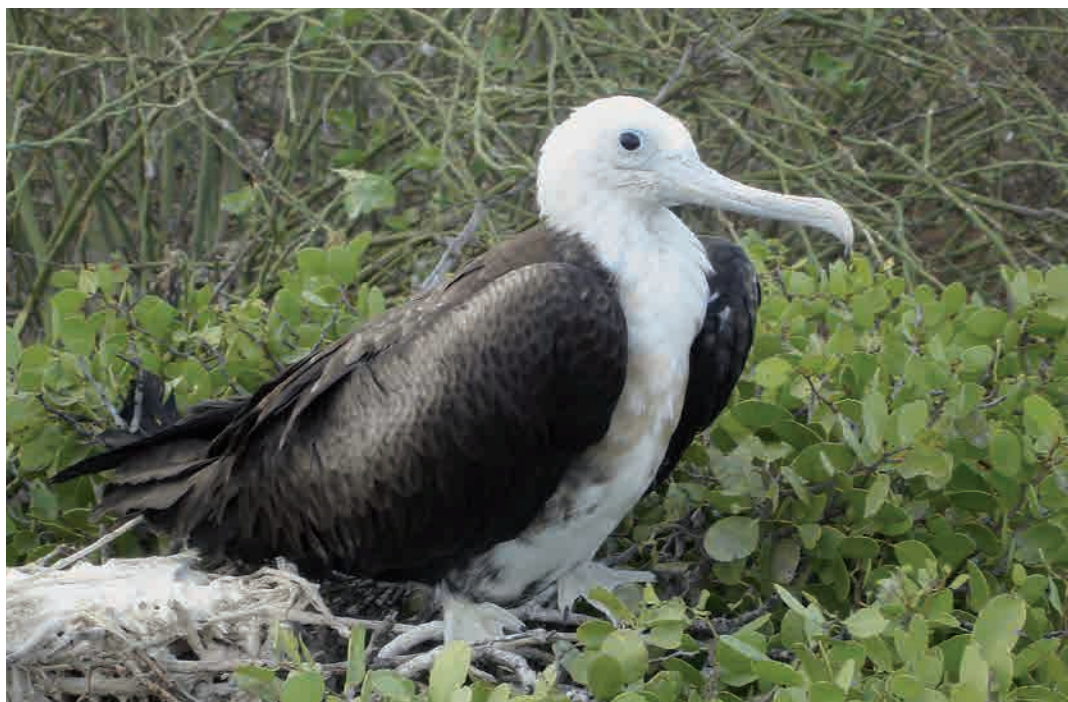
Midway-ørne havde dengang som nu et rigt fugleliv.