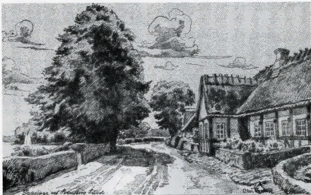
Strandgade 19 i Troense. (Tegning som motiv på gl. Nationaltelegram).

Huset, hvori familien boede, eksisterer den dag i dag – nemlig Strandgade 19. Huset fremstår smukt vedligeholdt med