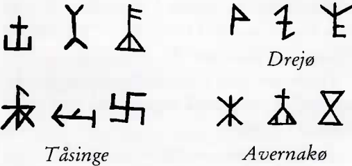
Eksempler på bomærker: